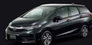
Photo: シャトル G-Honda SENSING (FF) ボディカラーはアレスティアムペールメタリック (有料: 32,400円) シャトル G-Honda SENSING 型式: 6BA-GKB 1.5L i-VTEC CVT (トルクコンバーター付)車/FF 車両本体価格の一例 (消費税8%込み) 1,775,520円